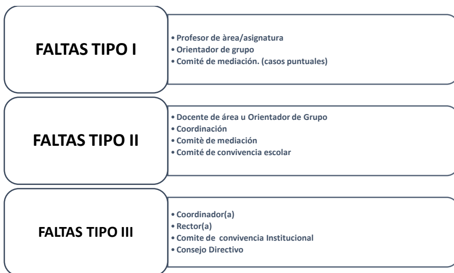
GRAFICO: PROTOCOLO PARA LA ATENCIÓN DE FALTAS TIPO I, II, III

PARÁGRAFO. El estudiante que incurra en alguna de las actuaciones contempladas en el artículo 90 de este manual tendrá valoración de 1.0 a 2.9 en la evaluación de desempeños actitudinales, comportamiento o convivencia escolar social del periodo en que el hecho se produzca.