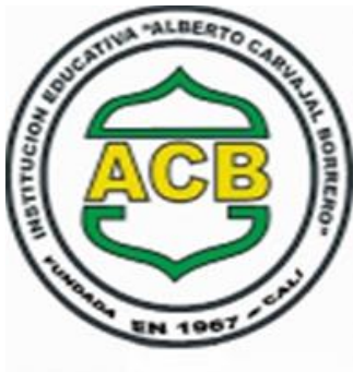
ESCUDO DE LA I.E. ALBERTO CARVAJAL BORRERO