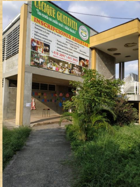
SEDE CACIQUE GUATAVITA Calle 54 #15 A-20