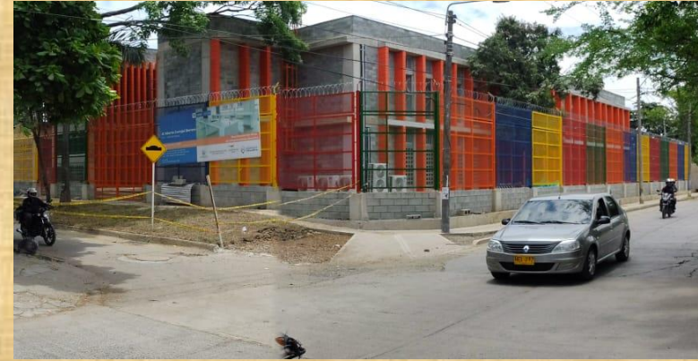
SEDE ABRAHAM DOMINGUEZ Carrera 14 # 57-19